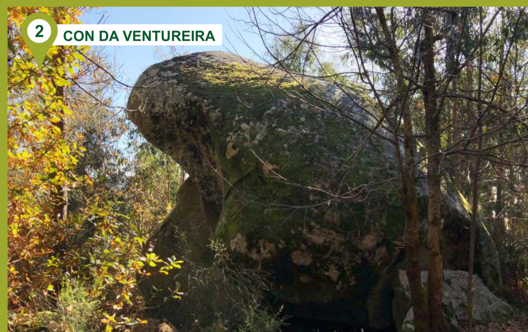
2 CON DA VENTUREIRA Una gran piedra de unos 6 m de altura. Antigüamente utilizado por los marineros como referente geográfico para orientar sus embarcaciones cuando entraban en la ría de Pontevedra, de ahí su denominación de "Con da Costa". Forma parte de la mitología local, aportando una hermosa leyenda que nos habla de una moura , guardiana de un palacio lleno de oro y demás tesoros bajo tierra...