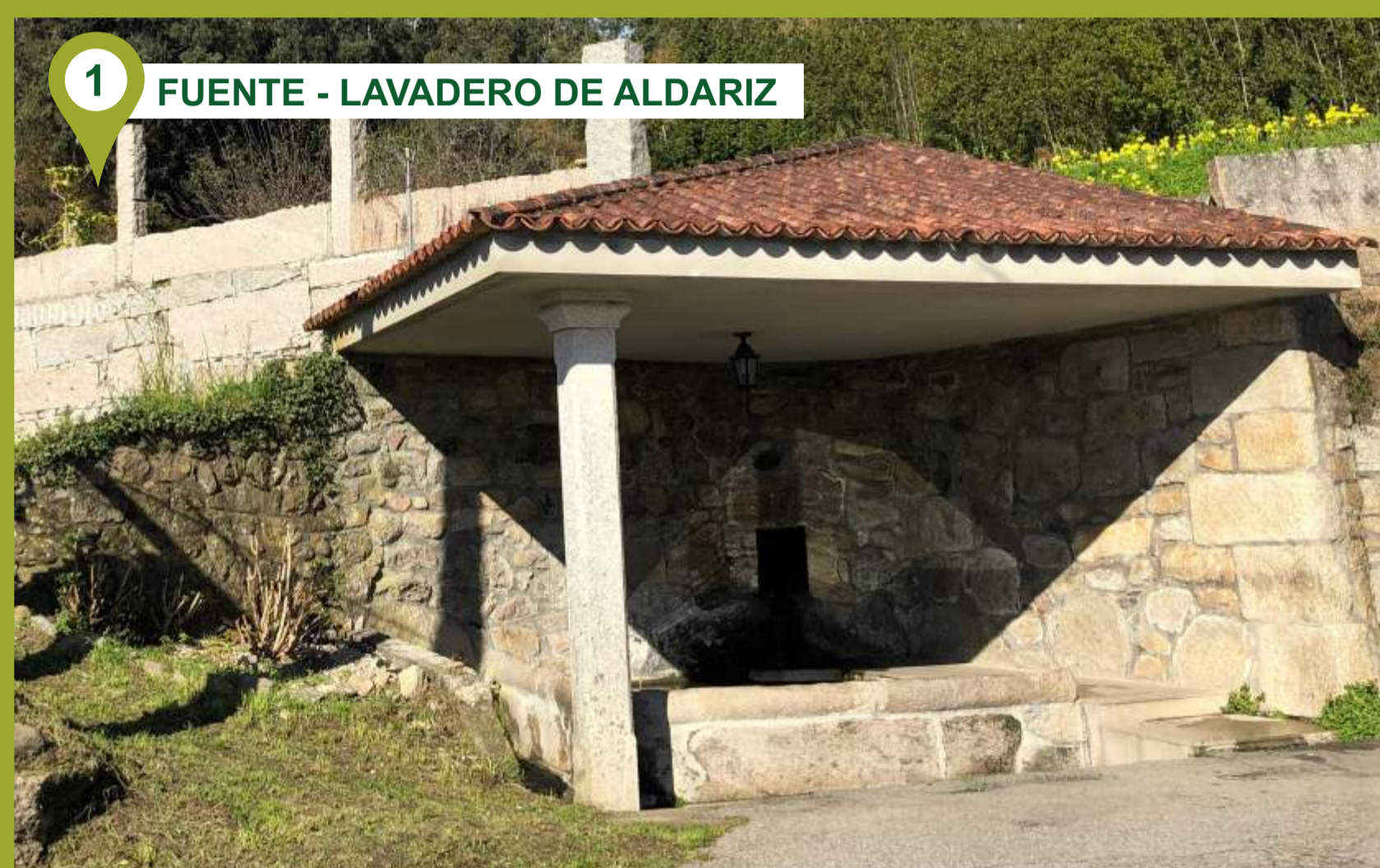
1 FUENTE - LAVADERO DE ALDARIZ Aldariz es uno de los lugares habitados más elevados de la parroquia de Padriñán (Sanxenxo), donde podemos contemplar su famosa fuente-lavadero, aparte de otros ejemplos de arquitectura popular (hórreos y casas antiguas). Tomando con referencia el sentido de las agujas del reloj, subiremos hacia el monte, adentrándonos en plena naturaleza y podremos disfrutar del Sanxenxo más desconocido.