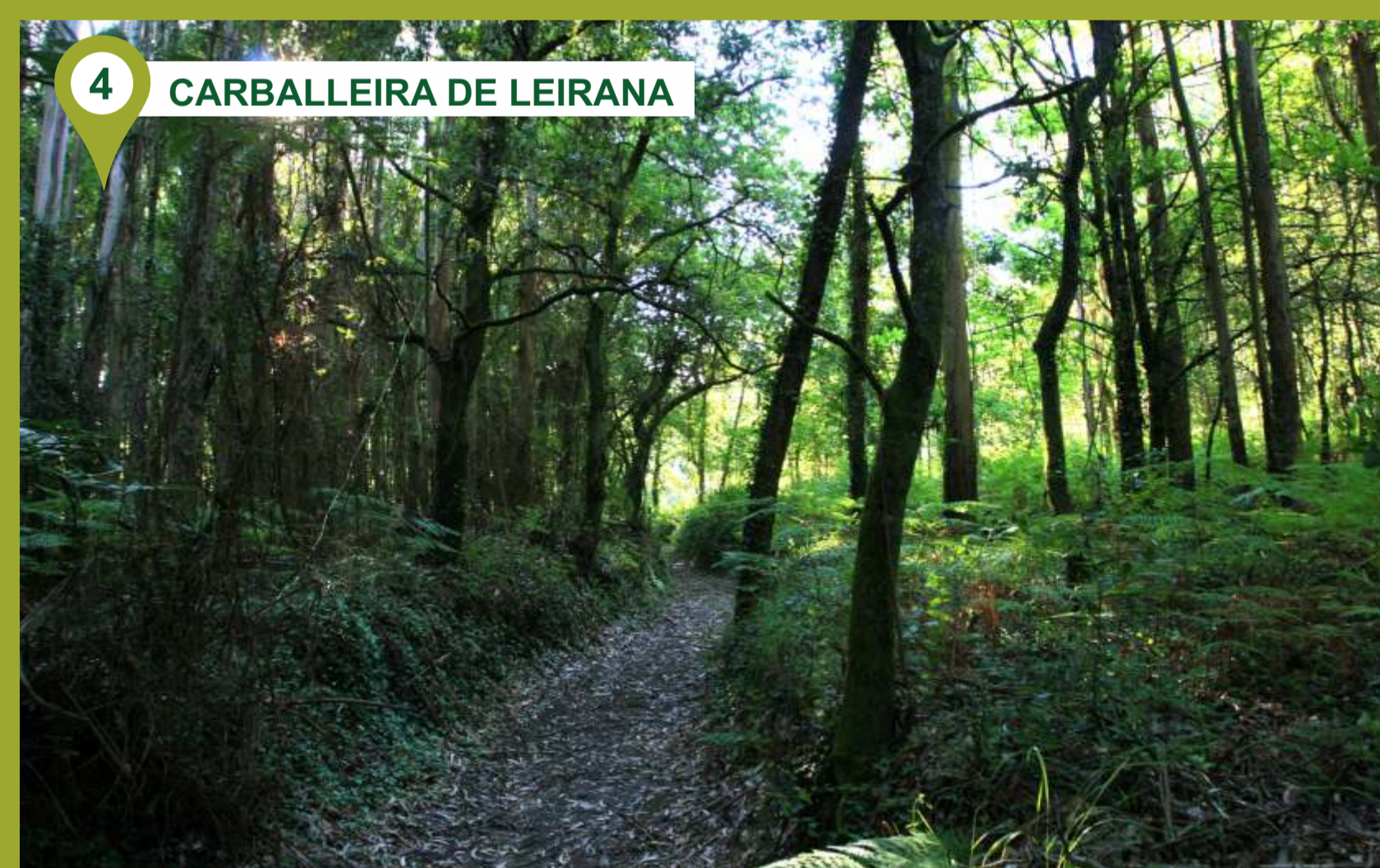
4 CARBALLEIRA DE LEIRANA A Carballeira de Leirana está en el corazón de la ruta, lugar de gran belleza que nos invita a disfrutar de la naturaleza en toda su plenitud. Siendo el carballo (roble) el árbol autóctono de Galicia por excelencia, cabe distinguir otras especies que hacen aún más rica la flora del lugar y la placidez del paseo. A lo largo del trayecto encontraremos los ya mencionados robles junto a laureles, castaños, arracianes, acebos...