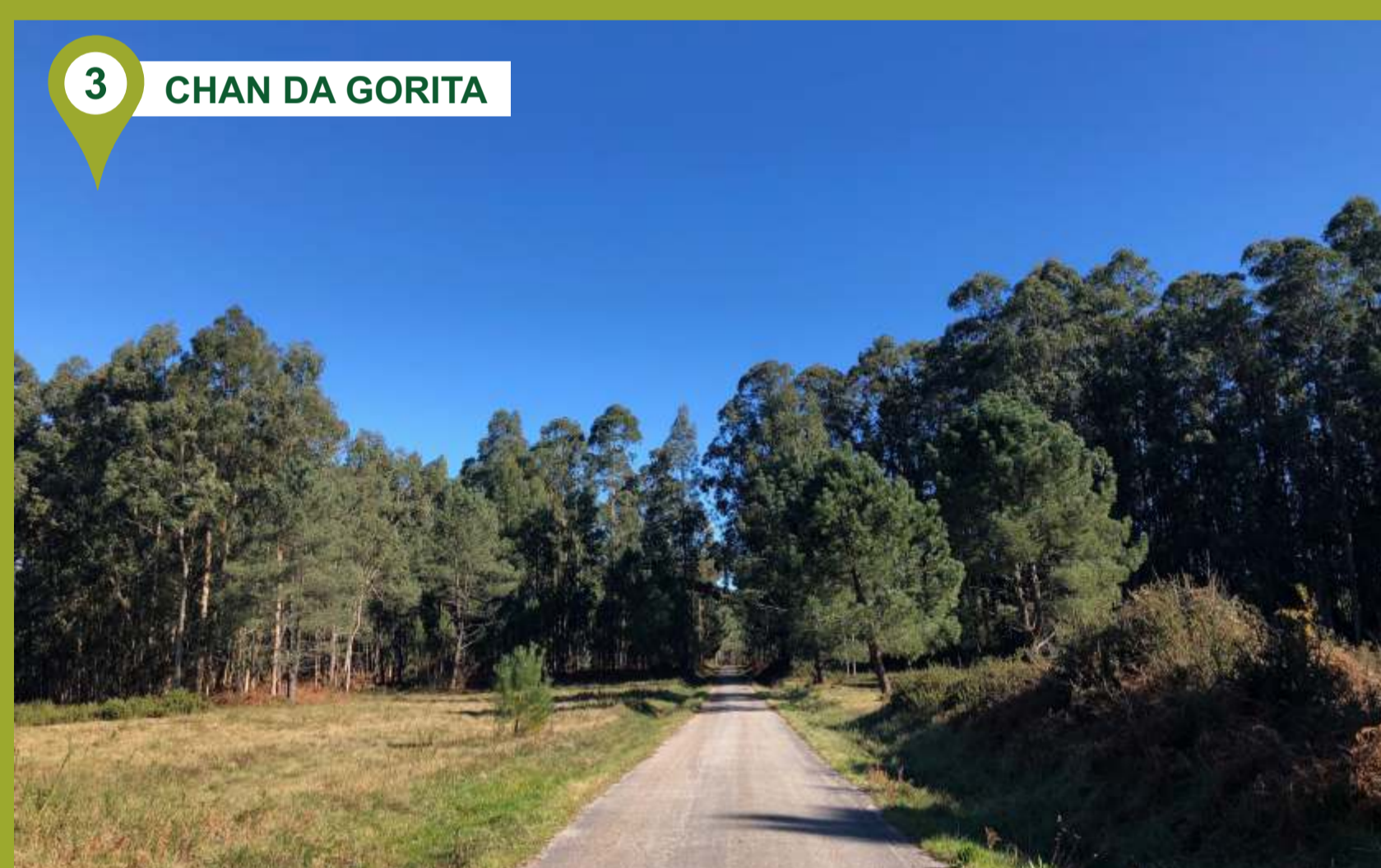
3 CHAN DA GORITA En la cota de máxima altitud de la ruta tenemos muestra de un conjunto megalítico de Sanxenxo denominado "Chan da Gorita", formado por varias mámoas o túmulos bajo los cuales se dispusieron las grandes piedras en forma de corredor de acceso y cámara (tendiendo al circular) para el enterramiento (individual o colectivo) con agua en algunas ocasiones (2000-1000 a. C.). Hoy en día están tapados por tierra y densa vegetación, aunque la paciencia e intuición, fijándose en la protuberancia del terreno, nos pueden dar la clave.