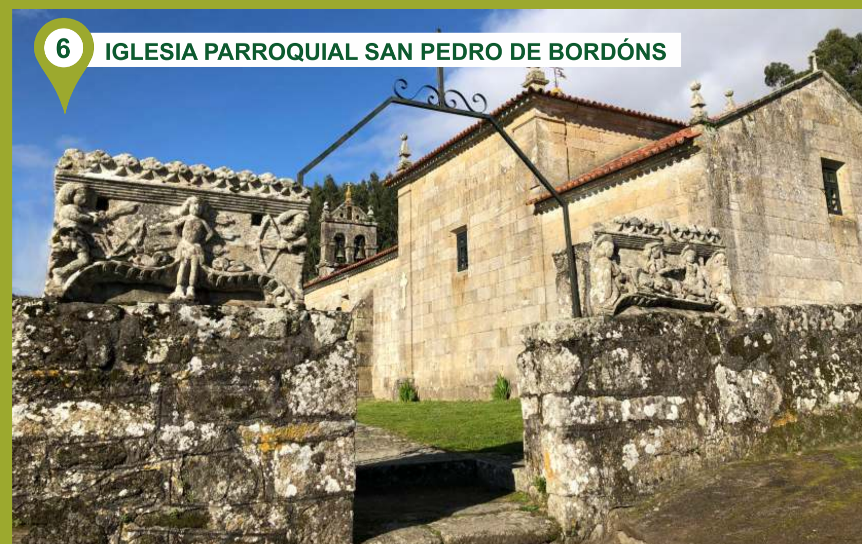
6 IGLESIA PARROQUIAL SAN PEDRO DE BORDÓNS El entorno de la iglesia de San Pedro de Bordóns ofrece un encanto que acompaña al conjunto de la ruta. Engloba un cementerio y un crucero que constituyen una de las más originales manifestaciones de la arquitectura popular gallega. Destacan, en la misma entrada al recinto, los relieves del osario: San Sebastián asaetado ocupando la vertical de la clave de un arco conopial y el Santo Sepulcro de Cristo.