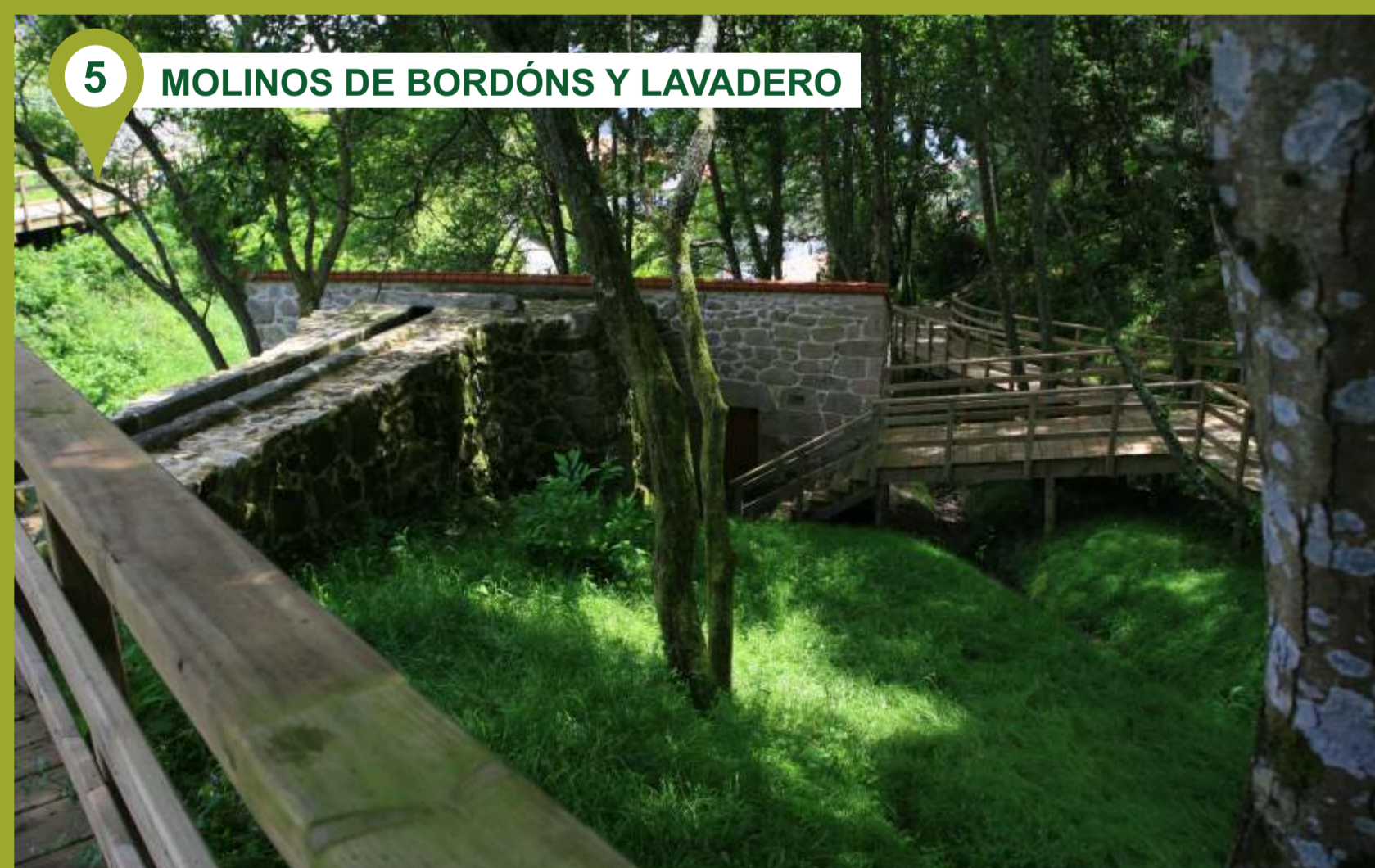
5 MOLINOS DE BORDÓNS Y LAVADERO En la parte más al sur de la ruta, en la parte baja del núcleo de Bordóns podemos visitar un molino de agua, varias fuentes y un lavadero. El molino, de dos ruedas y un gran canal, es de dimensiones considerables. En las cercanías otro molino está destinado a la hostelería.